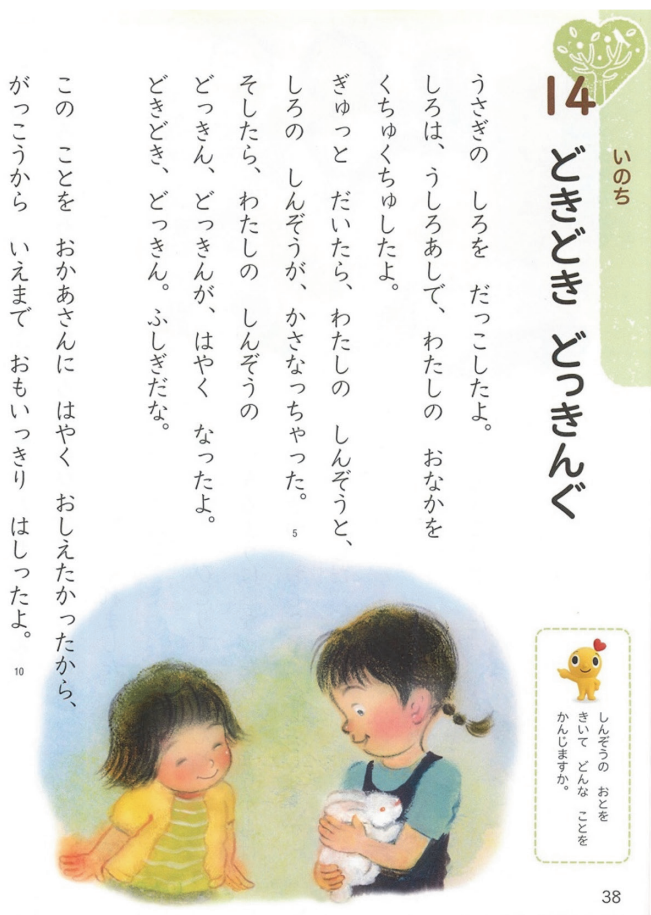
図2 触れ合いを推奨する例（東京書籍 どうとく 1年）。ウサギとの触れ合いに感動した子どもの様子が書かれているが、ウサギにとって抱かれることが負担になっている可能性については触れられていない。

文科省は長期の飼育を通して動物とふれあうことが望ましいとしている。また地域の獣医師会などとの連携でそのような活動を行うことも指導要領に記載されており、多くの自治体でふれあい動物教室などが開催されている。教科書に記載されているように触れる、抱く、鼓動を聴く活動は大切ではあるが、そのふれあいが、相手を思いやるといった情操教育に軸を置くのであれば、動物の立場にたった関わり方を教えることが求められる。